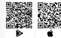
APPLICATION TWAVOX AUDIO POINT

COMMANDEZ ET PAYEZ EN LIGNE DE FAÇON SÉCURISÉE ET SIMPLE D'UTILISATION SUR LE SITE INTERNET DU CINÉMA : https://burma.montpellier.fr